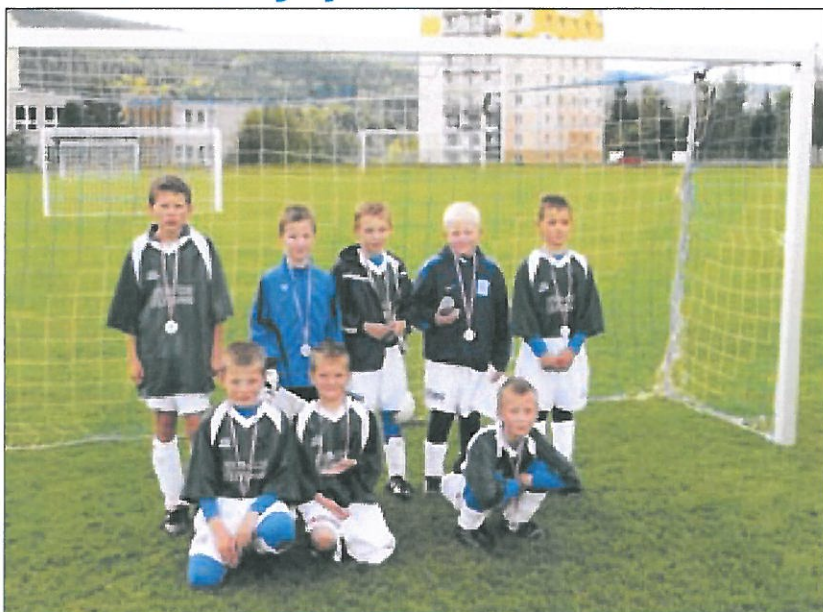
Žáci: II. místo na turnaji v Tanvaldě.